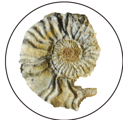
Kilianella sp. 南相馬市鹿島区小山田 小山田層 中生代白亜紀 大きさ：2.5センチメートル 採集者 新潟大学