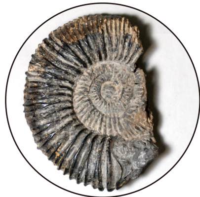
Subdichotomoceras chisatoi 南相馬市原町区深野 中ノ沢層 中生代ジュラ紀 大きさ：8.5センチメートル 採集者 八巻安夫