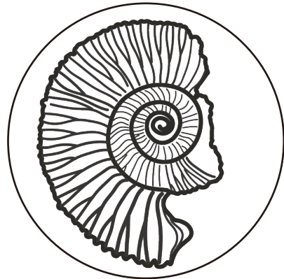
アンモナイト① (サブディコトモセラヌ・チサトイ)