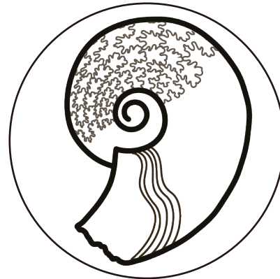
アンモナイト② (ハプロセラヌ)