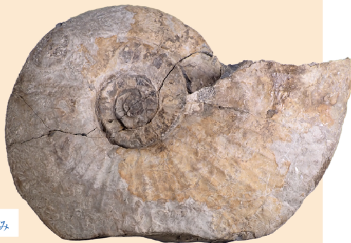
メソプソシア (いわき市産 / 白亜紀 / 福島県立博物館蔵)