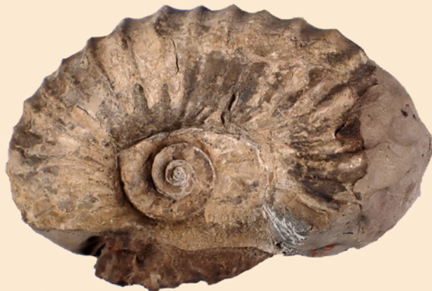
アナゴードリセラス (いわき市産 / 白亜紀 / 福島県立博物館蔵)