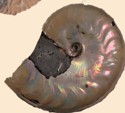
アコネセラス (ロシア産 / 白亜紀 / 福島県立博物館蔵)