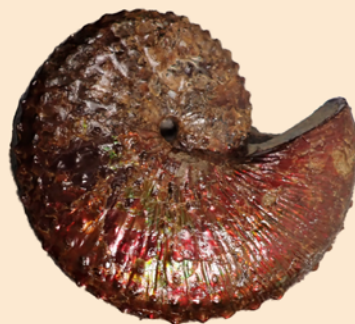
ジェレキttes (アメリカ産 / 白亜紀 / 福島県立博物館蔵)