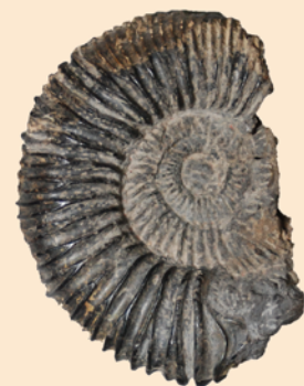
サブディコトモセラス (南相馬市産 / ジュラ紀 / 当館蔵)