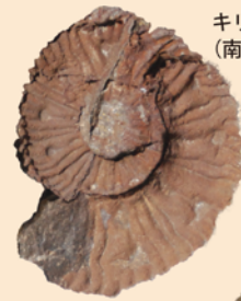
キリアニセラス (南相馬市産 / 白亜紀 / 当館蔵)