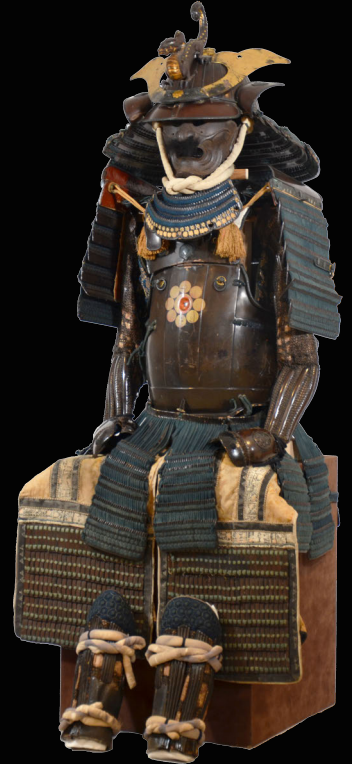
栗色塗縦矧二枚胴具足 (伝相馬家所用) 江戸時代 個人蔵