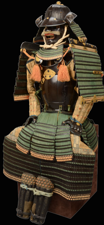
黒漆塗縦矧五枚胴具足 (伝相馬家所用) 江戸時代 個人蔵