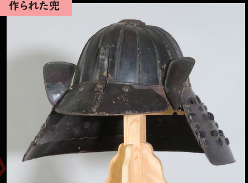
黒漆塗十八間筋兜 江戸時代末期（嘉永6年〔1853〕） 個人蔵 銘「中村住紀宗充 / 嘉永六癸丑正月吉日」