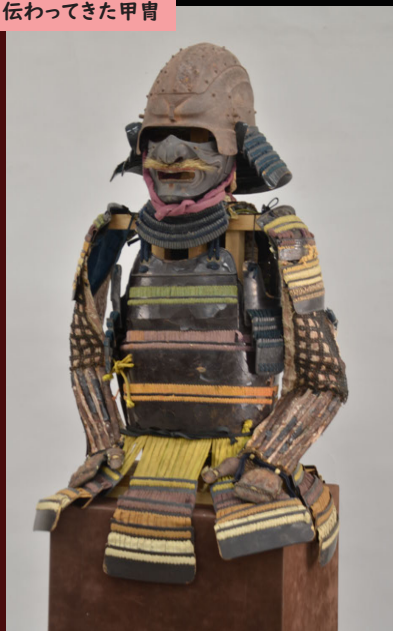
黒漆塗板札色々威二枚胴具足 江戸時代初期 泉田達生氏蔵