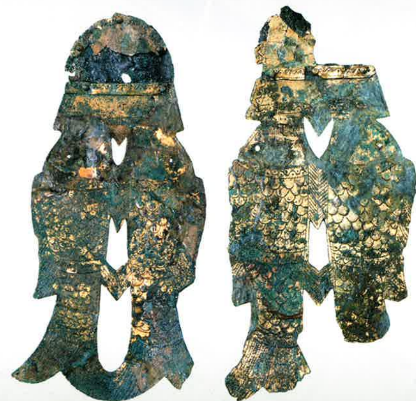
真野古墳群 A地区20号墳出土の金銅製双魚袋金具

銅板に金メッキを施したものであり、2匹の魚の形を胸ヒレ、腹ヒレ、尾ヒレの三箇所ずつなぎ、頭部には垂れ飾りとして使用できるように、穴が空けてあります。