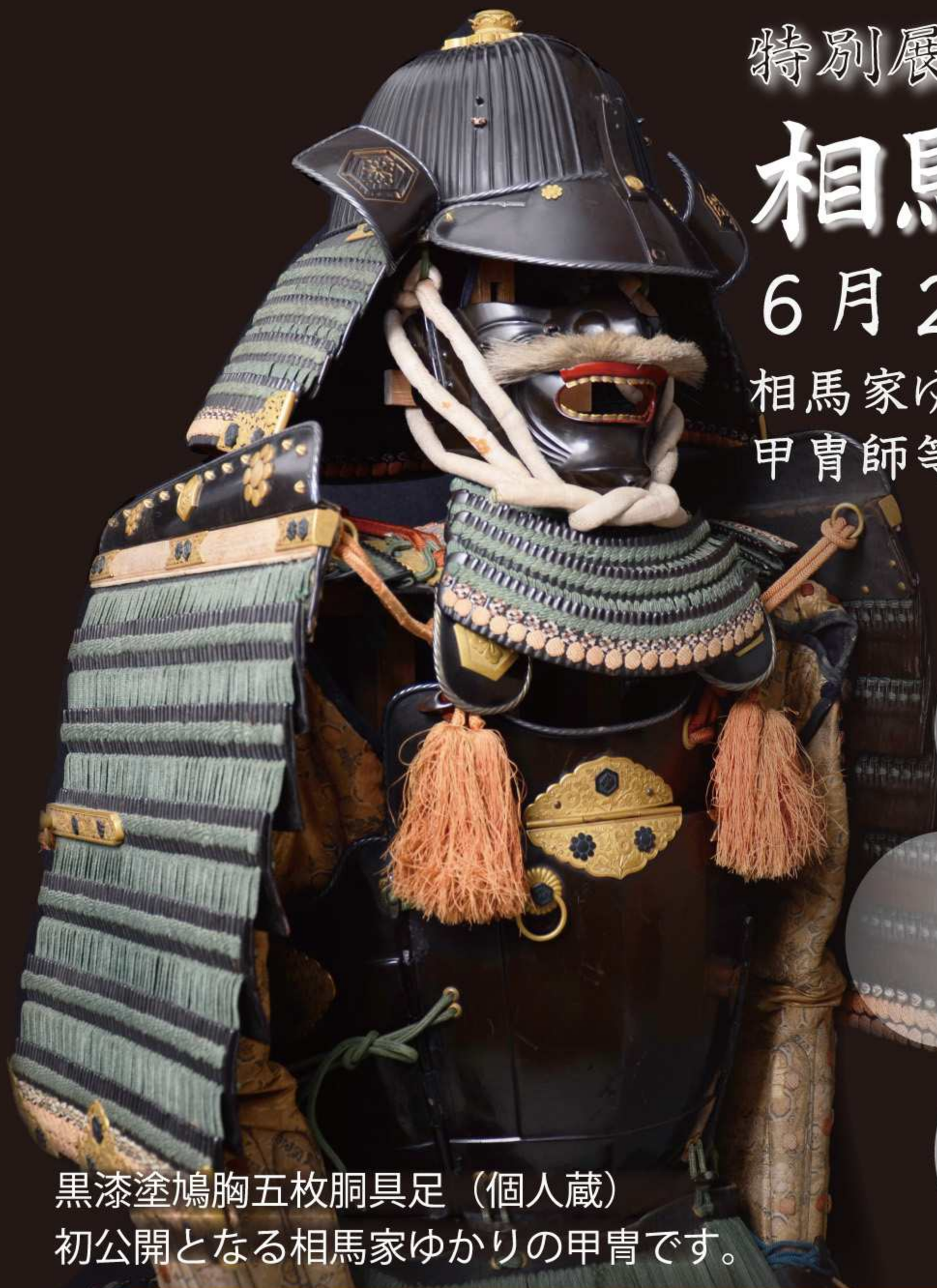
黒漆塗鳩胸五枚胴具足(個人蔵) 初公開となる相馬家ゆかりの甲冑です。

相馬家ゆかりの甲冑や、藩で製作された武具類、郷土に今も残る甲冑師等、野馬追が伝わる相馬地方ならではの文化を紹介します。 ※「物具(もののぐ)」とは「甲冑」のことを指します。