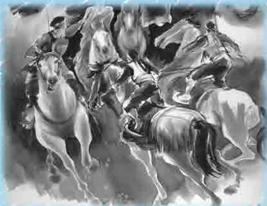
「相馬野馬追A」朝倉悠三 個人蔵