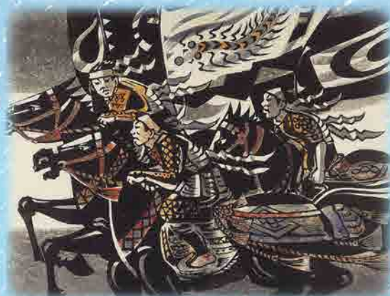
「野馬追讃歌'06」志賀一男 個人蔵