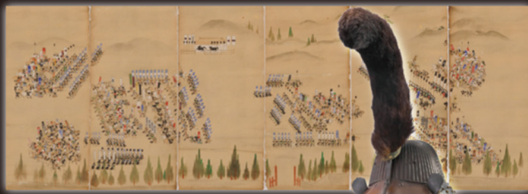
伊達成実所着・黒漆塗五枚胴具足 奥州相馬氏野馬追図屏風 太刀 宇佐美長光 (伊達市教育委員会蔵)