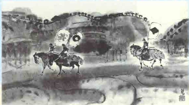
「戦のあと 相馬野馬追」米倉兌 伊達市梁川美術館蔵