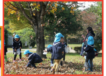
落ち葉のシャワーでおおはしゃぎ！