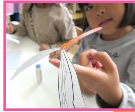
トンボの「やじろべえ」できたよ！