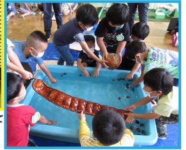
「この木の実、うかぶかな？」