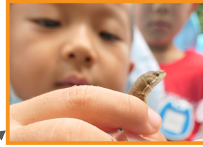
「カナチヨロ」つーかまえた！