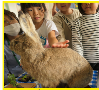
「ウサギの毛ってやわらかいね。」

今年度は市立幼稚園一カ所のみでの実施でしたが、次年度以降は市内の要望をいただいた幼稚園・保育園での実施を検討しています。お楽しみに！