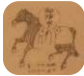
▲おみたらし 御神水を浸した お札のお守り