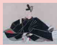
相馬昌胤像 掛軸 興仁寺