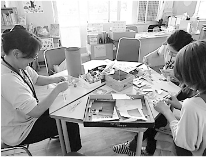
← 壁面作成中の図書ボランティア