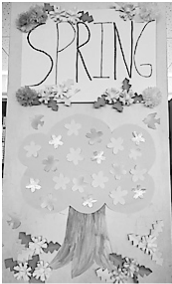
↓ 壁面（室内の柱4本に四季飾り）