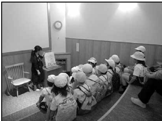
写真7 読み聞かせの様子