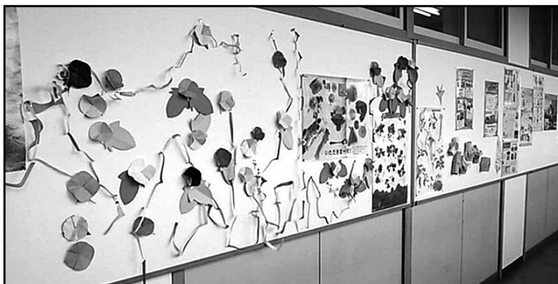
写真4 夏をイメージした装飾となった。