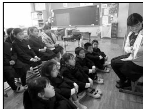
写真1 読み聞かせの様子