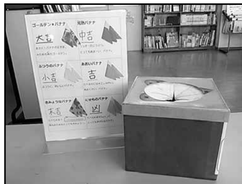
写真 1 1 今年の干支である猿にちなんだ「バナナおみくじ」