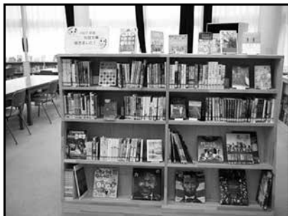
まんが本コーナーだった棚に杉並文庫を配架。