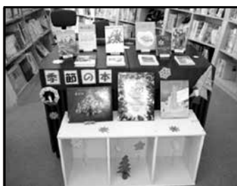
企画コーナー 「クリスマス」