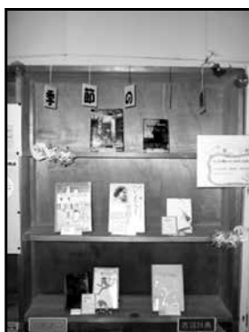
季節の本棚 「6月・梅雨」の本