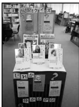
「伝記を読もう」 コーナー