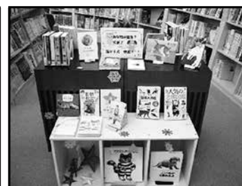
企画コーナー 「犬VS猫特集」