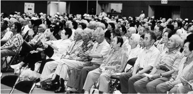
▲ 昨年の敬老会のもよう