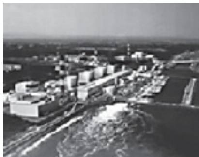
▲福島第一原子力発電所

答 私は福島第一原発に調査に行った。消火体制、断層調査など、まだまだ問題がある。 原発の安全性があらためて疑問視されている。浪江小高原発建設を推進する姿勢をこのまま続けるべきではない。 市民に誘致の是非の信を問うべきだ。 問 73年の小高町議会誘致決議