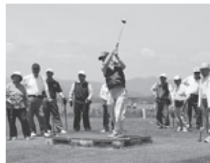
▲賑わいのある牛島パークゴルフ場