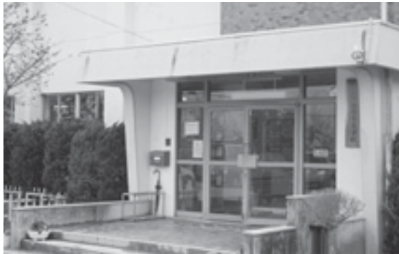
県立相馬養護学校

問 過般の県議会で相馬市立養護学校の県立移管に伴って、建て替えの有無について質疑があった。県の教育長は、今年度の調査委員会の論議を踏まえて検討するとしている。現在、養護学校に通学している生徒さんは6割近くが南相馬市の子供達である。保護者の皆さんをはじめ、市民の多くは鹿島区に県立学校が1校もないことから、誘致実現の期待は真に大きい。本市として、県の方針をどのようにとらえ、誘致に向けた運動をいかに展開する考えか伺う。 答 平成22年度に、県は新築の必要性など、検討する関係市町村長や保護者、