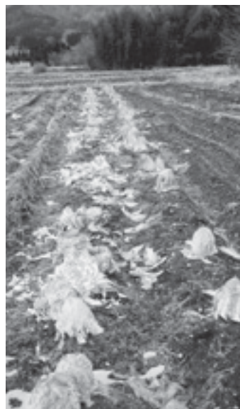
サルによる被害（鹿島区）

答 民間と同様な経営感覚を取り入れ、無駄、無理を排除する。市民生活優先とし、職員意識改革に努め、私の給与削減は気概であり、与削減は気概であり、職員の給与削減は今のところ考えていない。融資については、保証制度の活用を前提に制度設計をする。職員教育は人材育成基本方針により取り組む。機構改革は簡素で効果的な行政体制とする。株式会社の具現化に努める。