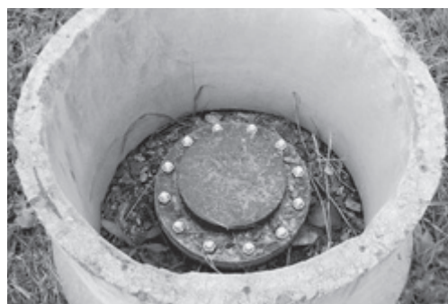
温泉の掘削をした深井戸（牛島地区）