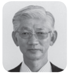
高野 光二 議員