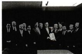
赤羽国土交通大臣への要望活動