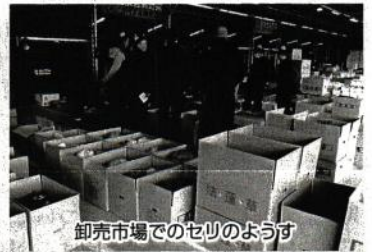
卸売市場でのセリの様子

※趣旨採択：願意については理解できるが、実現することが困難な場合などに便宜的に「趣旨には賛成」とすること