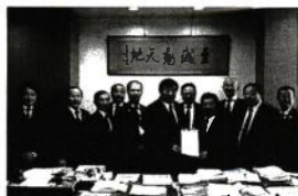
亀岡文部科学副大臣への要望活動