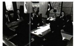
太田県議会議長への要望活動