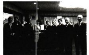
森法務大臣への要望活動