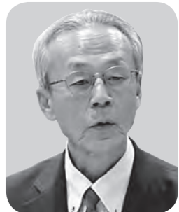
渡部 寛一 議員