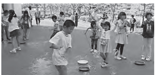
子どもの人数に国保税課税は？

「誰もが払える国保税に引き下げるための国庫負担を増やすこと」「子どもの均等割保険料軽減策実現を」国・県に強く求めていきたい。