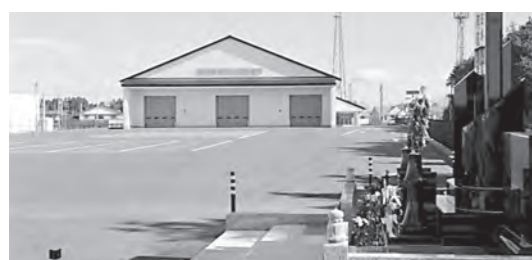
防災物資備蓄センター 消防団員の顕彰碑

「誰もが払える国保税に引き下げるための国庫負担を増やすこと」「子どもの均等割保険料軽減策実現を」国・県に強く求めていきたい。