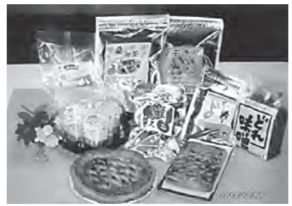
農産物の6次化製品を 目指す研修(青森県にて)

「誰もが払える国保税に引き下げるための国庫負担を増やすこと」「子どもの均等割保険料軽減策実現を」国・県に強く求めていきたい。