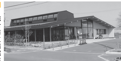
多目的施設 ゆらっと

問 高齢者がコミュニケーションのできる公共の場が必要と考え、生涯学習センターを活用し高齢者の憩いの場を設けることについて