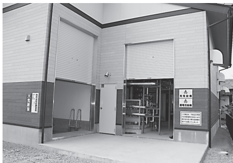
大町地域交流センター

も拡充していく考えか伺う。 【答弁】 国・県の制度に基づいて助成される特定不妊治療費について、今般改正があった。初回が30万円、2回目以降も30万円だが、市の制度では、今まで同様、初回30万円、2回目以降は15万円という設定をしている。今後の申請状況を踏まえ、令和4年度から保険適用となることから、制度の見直しを検討しなければならない。