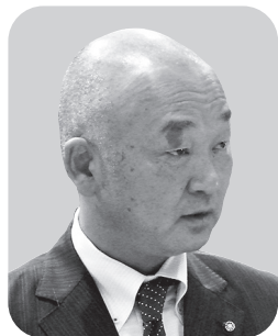
高橋 真 議員