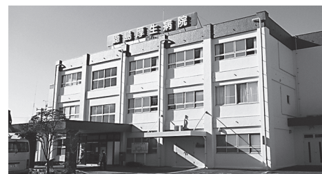
在宅療養支援病院として活躍する鹿島厚生病院

答 高度急性期医療から在宅医療、介護までの医療提供体制の整備に向けて、医師会とも進めていきたい。 問 高齢者は1日ベッドで寝ていると1年老化が進むと言われるように入院自体がリスクになる。一方、自宅に戻ると栄養状態が悪くなるケースも多い。環境整備を進めながら、在宅医療に関する意識や理解の醸成が同時に必要ではないか。 答 県の地域医療構想でも、地域が目指す医療・介護の姿として、医療を提供する立場と受ける立場の双方が一体となって取り組むべきと言われていている。市民の理解が深まるよう推進したい。