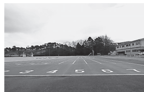
雲雀ヶ原陸上競技場

【質疑】 陸上競技場については底地問題があり、買い取って本腰を入れて、地域に貢献するグラウンドデザインを基本に置いてスポーツに取り組む考えがあるか。