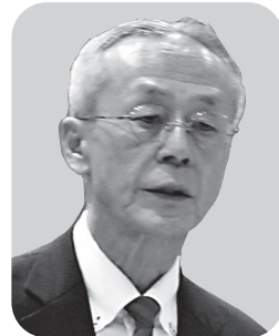
渡部 寛一 議員