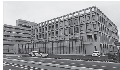
南相馬市立総合病院 全景