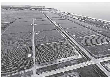
真野右田海老太陽光発電所

地域住民相互の交流の活性化と地域コミュニティ形成を図るため、大町地域交流センターの管理運営を行う。