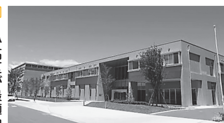
ロボットテストフィールド内の研究棟