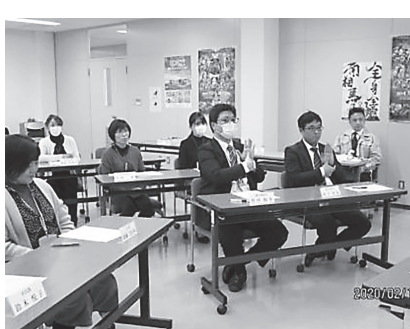
市職員の手話講習

南相馬市手話言語の普及及び障がい者コミュニケーション支援条例制定について 【概要】 手話を言語として位置づけ、市民等に対する手話への理解促進や普及を図るとともに、手話以外の広く障がい者の特性に応じたコミュニケーション手段への理解を促進し、全ての市民が共に生きる地域社会を実現するため、市の責務、市民・事業者の役割、手話を学ぶ機会の確保、コミュニケーション支援者の養成、災害時の対応などを盛り込んだ条例を新たに制定する。