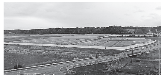
大量の遮へい土だけが残される「小高東部仮置き場」