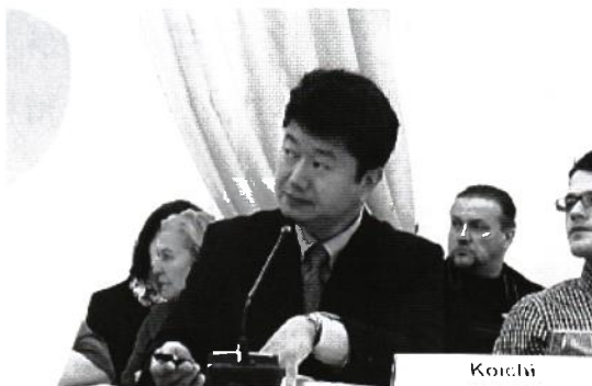
ウクライナ国立キエフ工科大にて、「フクシマの現状と課題」を発表しました。

公文書や統計データの改ざんや偽装？そして、政府が作った1千兆円の赤字が国民の責任だとして「増税」。民間企業より給与が少ないとしてダントツ世界一の公務員や国会議員のさらなる給与アップ。益々、所得格差が広がっていく。その陰で「子ども食堂」が全国で2,200軒を超え、利用者は100万人。いじめや自殺、犯罪に繋がる貧困は国家の犯罪である！