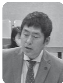
岡崎 義典 議員

医学部定員の増員には同意しかねる。まず医師の養成には最短でも10年を要し即効性がない。加えて、相双医療圏の医療需要は入院が2030年にピークと推計され、外來は既に減少傾向にある。行うべきは医師偏在対策の強化と診療科偏在対策であり、本請願については不採択とすべき。