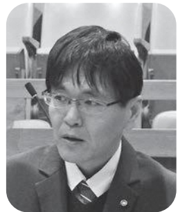
表 信司 議員