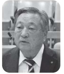
平田 武 議員