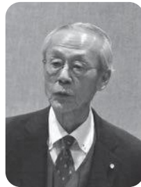
渡部 寛一 議員

本請願は損得ぬきに市民のために活動している機関からです。相双医療圏では医師不足が続いています。委員会結論は国が増員を言わないから、請願を否決するような結論になっています。本市の実情と将来に禍根を残してしまします。今すぐに手を打つために、本請願は採択すべき。