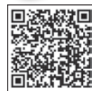
渡部 一夫 議員