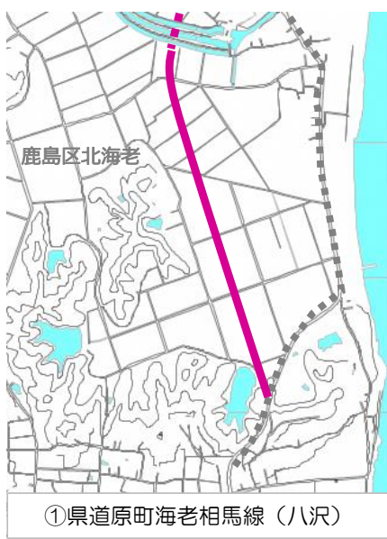
① 県道原町海老相馬線（八沢）