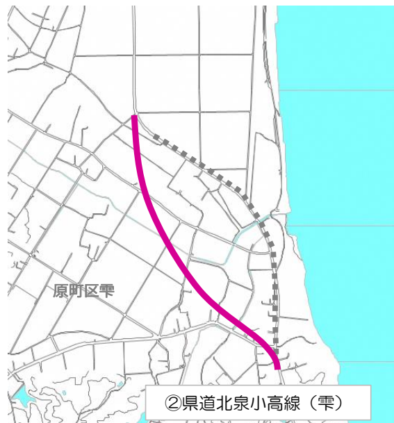
② 県道北泉小高線（雫）