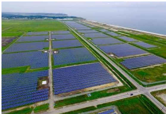
真野右田海老地区