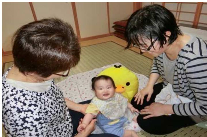
小高区認定こども園イメージ