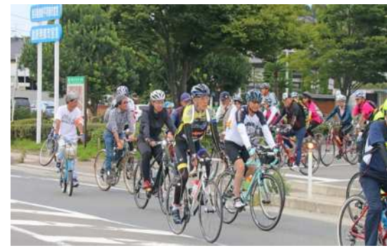
小高交流センター