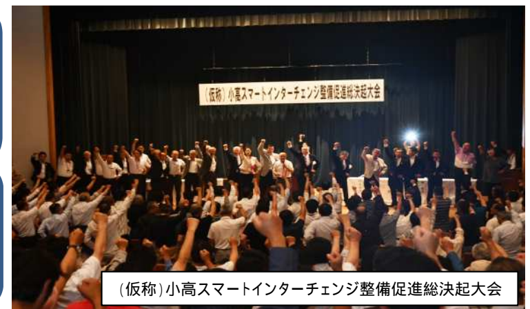
(仮称)小高スマートインターチェンジ整備促進総決起大会