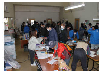
ボランティアセンター受付

活動内容は、避難所運営補助や物資の受け入れ、遺留物洗浄、学習指導など、多岐にわたった。