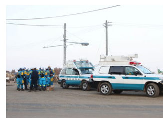
静岡県警による不明者の捜索

福島県警はもとより、警視庁、千葉、群馬、静岡、長野、奈良など全国の県警から多くの警察官が応援に入り、交通整理や捜索活動、避難所対応などを行った。