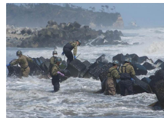
第一空挺団の活動状況

3月11日に陸上自衛隊福島駐屯地の第44普通科連隊員65人を皮切りに、陸上自衛隊新潟県高田駐屯地の部隊、陸上自衛隊第一空挺団などが続々と南相馬入りした。不明者の捜索のほか、自宅退避者の安否確認、瓦礫の撤去のほか、物資の運搬、炊き出し、仮設風呂の設置など、さまざまな支援を行った。