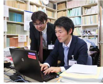
杉並区派遣職員の方々

派遣職員は、物資の受け入れや受払い作業、応急仮設住宅等申請受付、放射線モニタリング調査、保健師業務、税務業務、復興計画の策定、除染等、あらゆる部署に配属され多様な業務携わり、南相馬市の支援にあたった。派遣期間も数日での入れ替え、週単位での入れ替え、数ヶ月あるいは年単位の中長期などさまざまであり、中には無期限派遣の職員もあった。